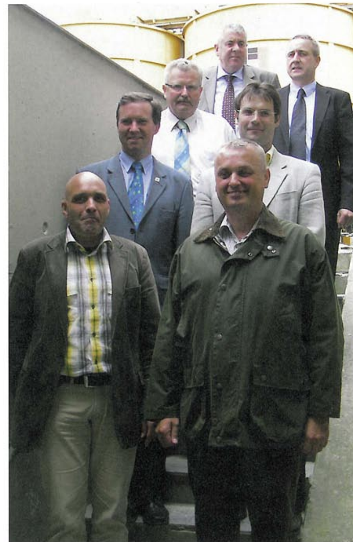
ÖKOPROFIT-Teilnehmer in den Landkreisen Augsburg und Aichach-Friedberg 2008/2009: